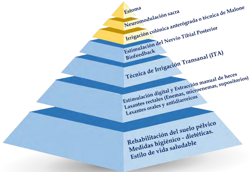
Figura 4. Pirámide de decisión del tratamiento de la IFO. Adaptada de Emmanuel et al. 151

En la tabla 12 se reflejan las intervenciones autónomas que pueden indicar o recomendar las enfermeras de cuidados avanzados en DI.