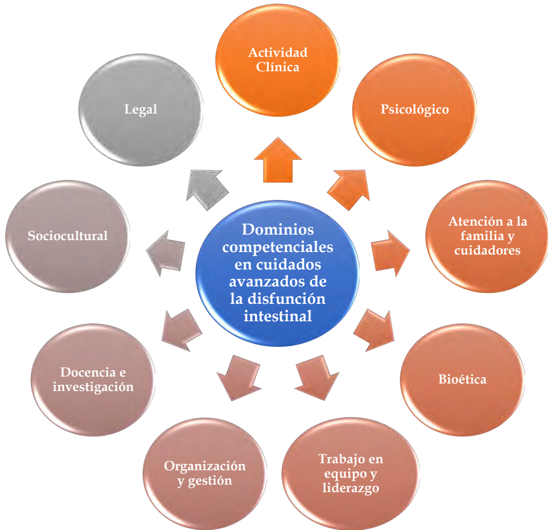
Figura 2. Conocimientos y aptitudes identificadas en la actuación enfermera en el ámbito de los cuidados a personas con disfunción intestinal.

La enfermera de cuidados avanzados en la DI, en el campo asistencial, desarrolla su actividad basada en un modelo biopsicosocial que integra la visión individual con la familia y personaliza los cuidados de experto. Para ello requiere desarrollar intervenciones educativas adaptadas a las necesidades de salud de personas con alta complejidad de cuidados, gestionando los recursos disponibles para mejorar la calidad de vida, realizando una atención holística. La aportación de los profesionales debe ir encaminada a empoderar a los usuarios, mejorar los resultados, la satisfacción y calidad de vida de las personas. Las enfermeras del ámbito de los cuidados de personas con DI deben tener conocimientos,