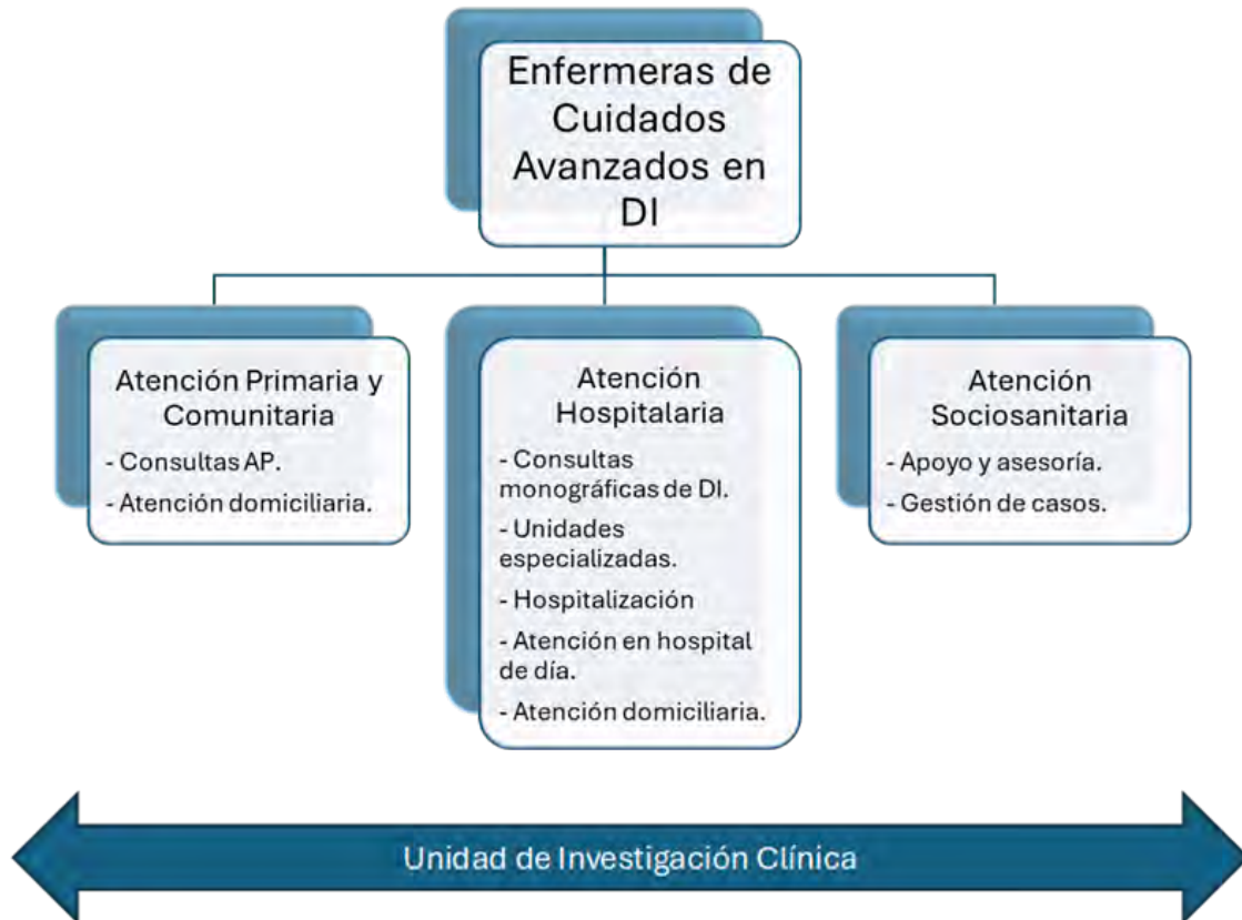
Figura 1. Ámbito de actuación de la enfermera en cuidados avanzados en la DI.